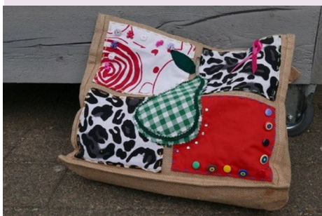
Creatief met naald en draad

De Oase is tijdens de vakantie open. Je bent nog steeds welkom. Ook op vrijdagmorgen, tot en met 17 augustus, voor het creatief handwerken .