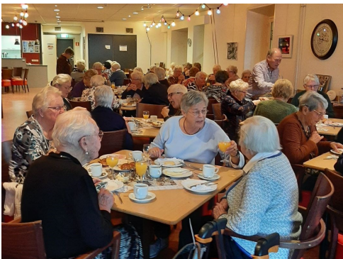
Foto-impressie 80-plusdag op 14 oktober 2022