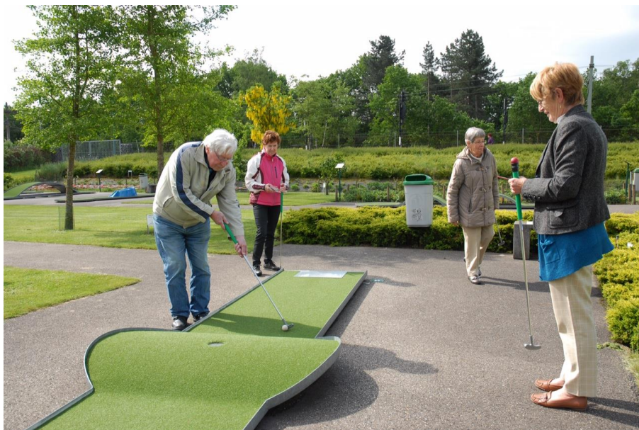
Onze leden actief op de baan.