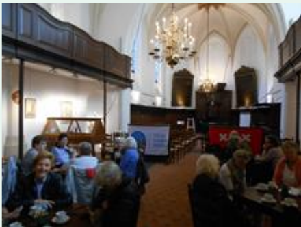
De ontvangst in de Waalse kerk te Breda.

Tot woensdag 9 november kunnen Rijense 50-plussers zich opgeven voor een diner bij het Aziatisch restaurant. Dit kan bij Henk van Opstal (06 42 95 78 00).