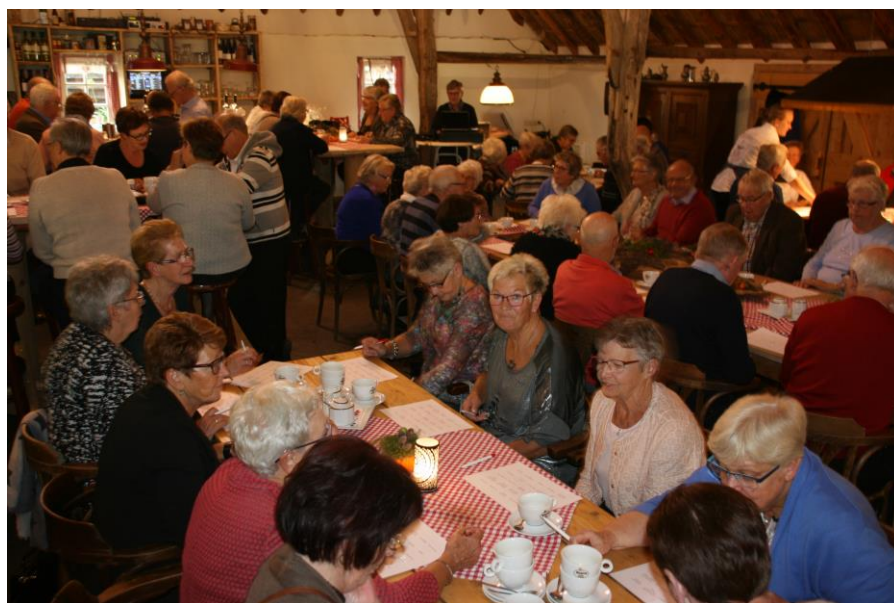
De muziekbingo in de Jacobushoeve